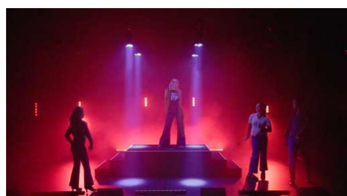
Flickor som försvinner Théâtre National de Suède