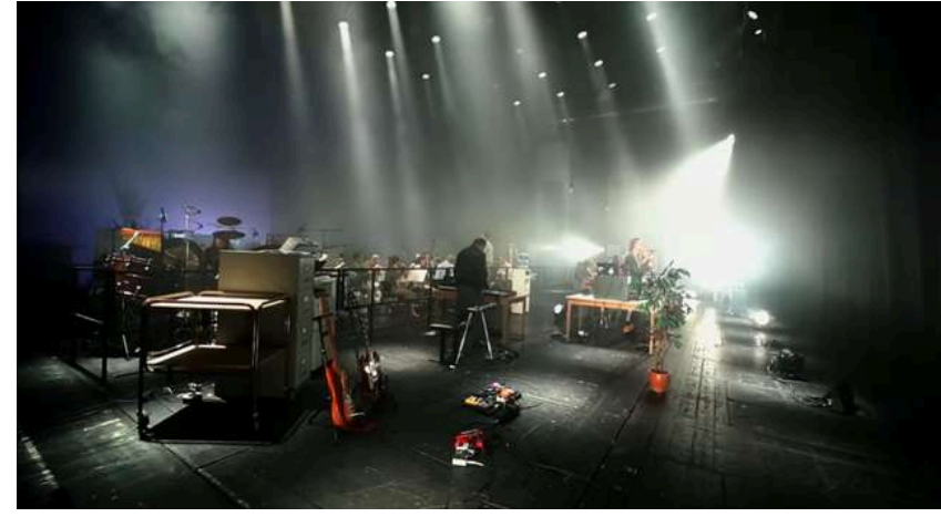
Kite (keyboards) Stockholm Royal Opera, Stockholm, 2019