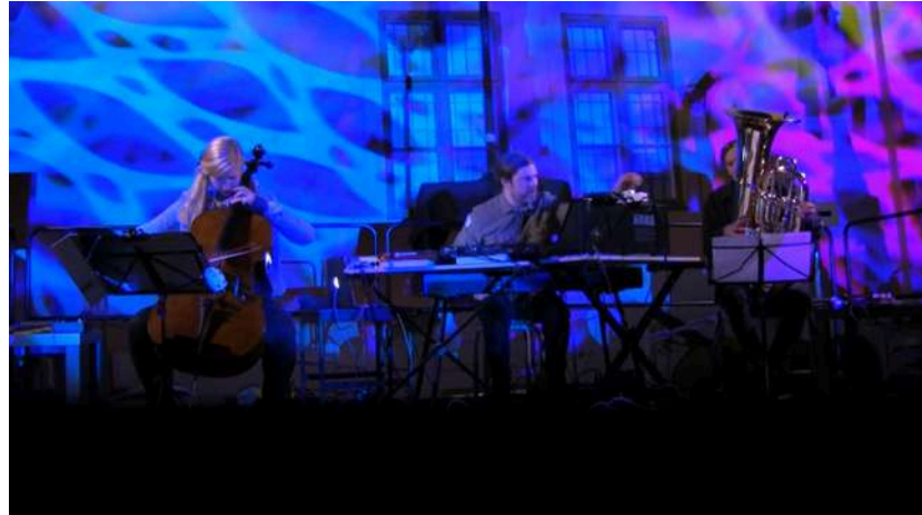
Concert de Jukka Rintamäki (keyboards) Uppsala Castle, 2018