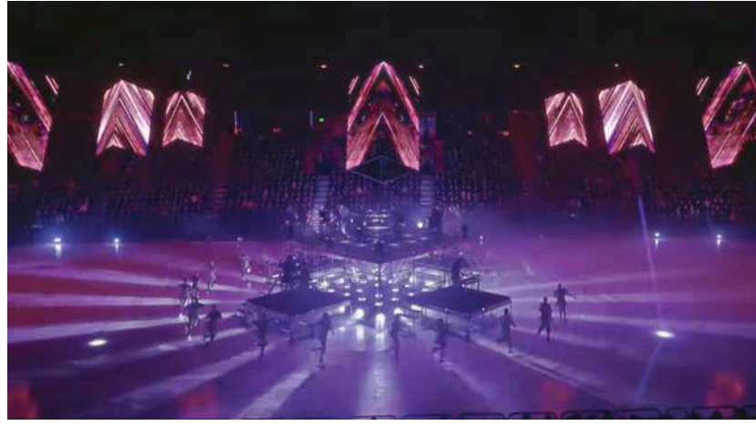
Heartless Places du groupe Kite (keyboards) Avicii Arena, Stockholm, 2025